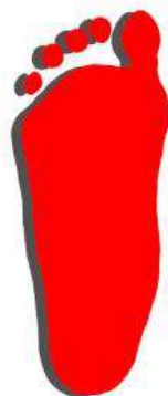
Плоскостопие 3ья степень

Исчезновение арки стопы и большого пальца