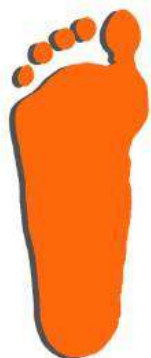
Плоскостопие 2ая степень

Увеличение пятки и утолщение внутреннего края стопы