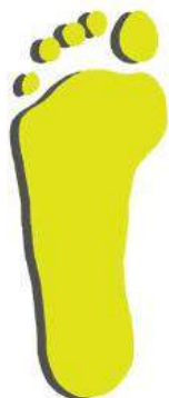
Плоскостопие 1ая степень

Увеличение пятки и утолщение внутреннего края стопы